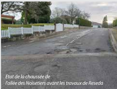
Etat de la chaussée de l'allée des Noisetiers avant les travaux de Reseda