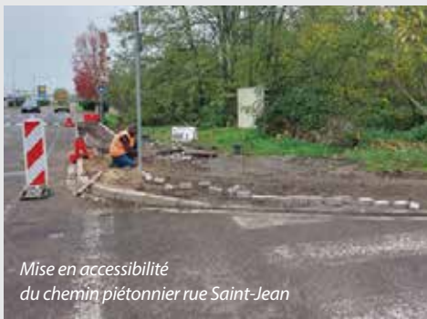
Mise en accessibilité du chemin piétonnier rue Saint-Jean