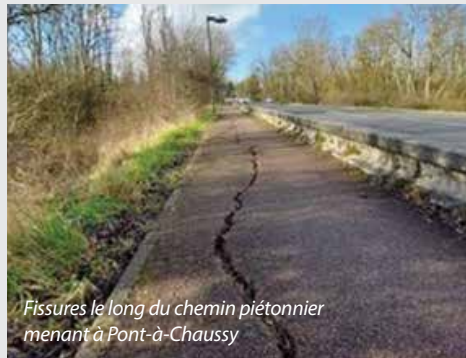
Fissures le long du chemin piétonnier menant à Pont-à-Chaussy