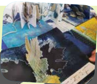
Seconde réalisation de Catherine Matte pour le « Livre au Vert ».