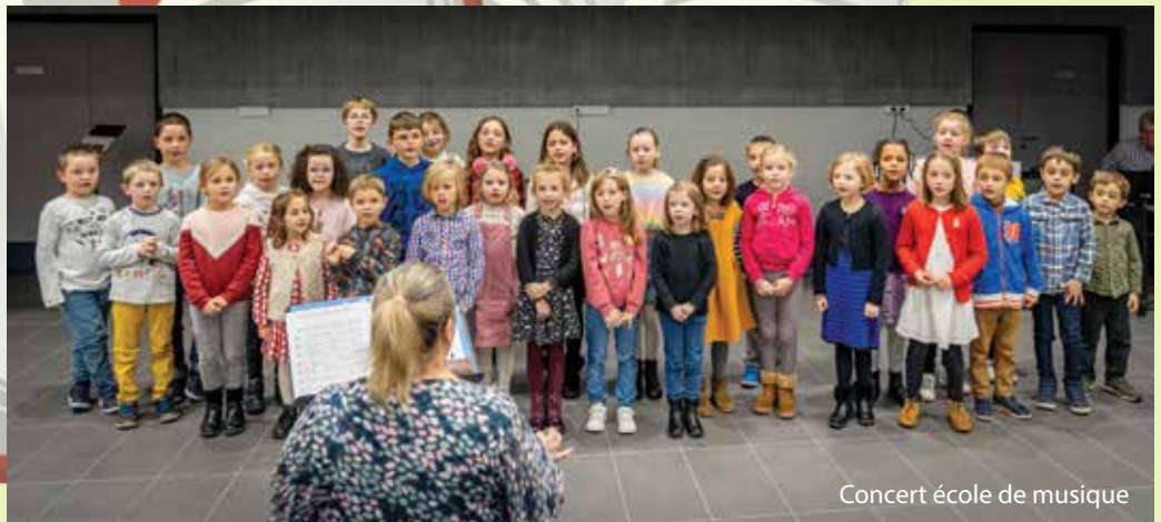
Concert école de musique