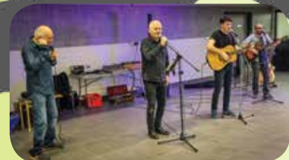
Les 4 membres de l'ensemble Les Gusses du Cru