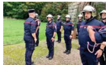
Remise de la fourgère

Sur réservation : restauration sur place