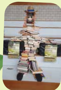
Les bénévoles du Syndicat des Initiatives ont fait un énorme travail de décoration manuelle afin de susciter l'intérêt visuel des visiteurs