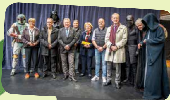
Les officiels après les discours d'inauguration avec leurs gardes du corps des Star Wars de la 501ST French Garrison