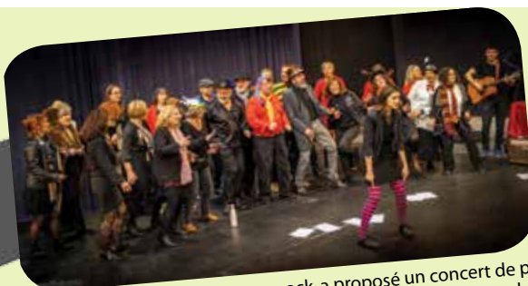
Les Voix Zinzins, chorale pop-rock, a proposé un concert de plus d'une heure dans la grande salle du gymnase pour le grand bonheur du public et des auteurs