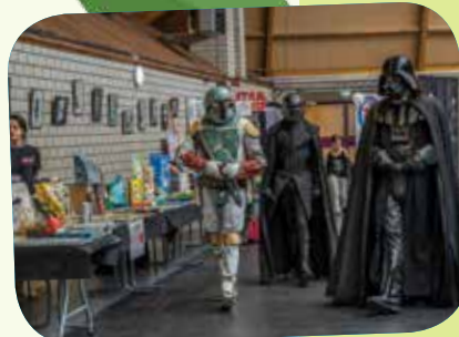
La librairie « Le Carré des Bulles » et les membres de la 501 st French Garrison