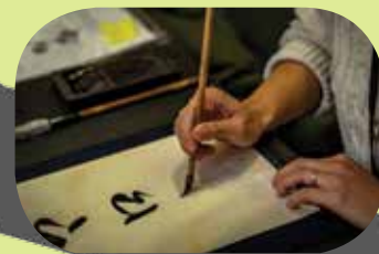
Rei Hashimoto proposait d'écrire votre prénom en calligraphie japonaise