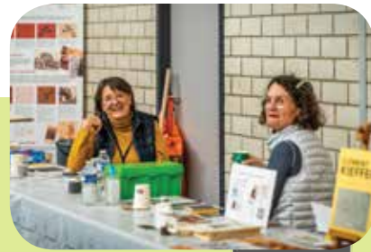
L'atelier gravure proposé par les bénévoles de l'Association Clément Kieffer de Varize

Tout un programme entre littérature, rêves et réalité.