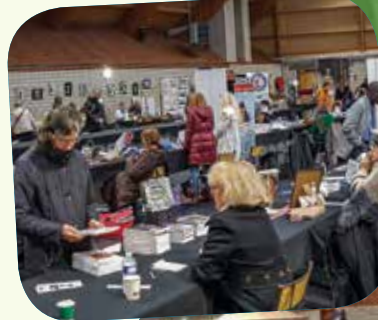
Les visiteurs à la rencontre des auteurs