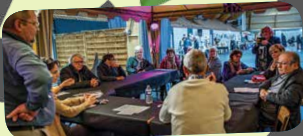
Table ronde sur le thème de la fantasy héroïque