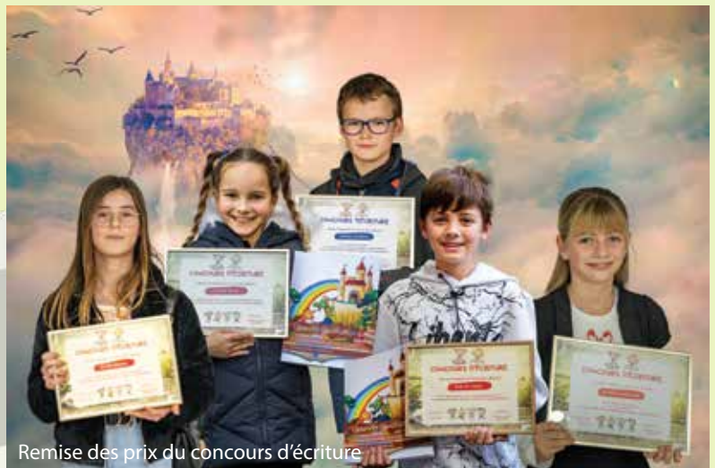
Remise des prix du concours d'écriture